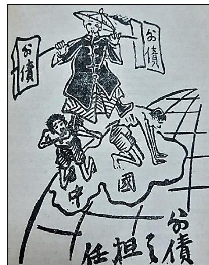
Кто несёт тяготы займов

политической жизни. По мнению историка, китайский пролетариат также не мог иметь существенного значения для политической жизни, так как он составлял весьма незначительную часть 400–миллионного населения страны.