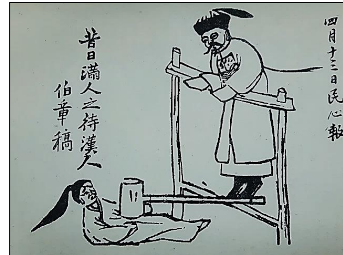
Карикатура. Как прежде манчжуры заботились о китайцах