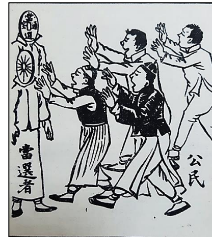
Всякий тянется к капиталу